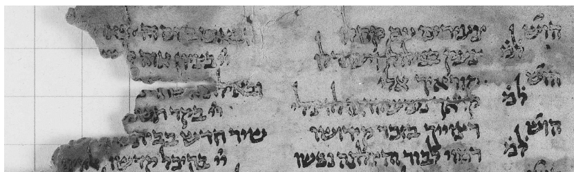
כ"י ניו-יורק, בית המדרש לרבנים, אדלר 3443.6 ע"א